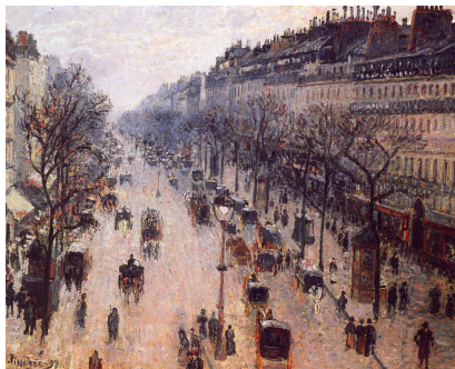
Pissarro – 1897