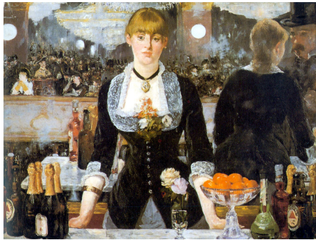
Manet - Le Bar aux Folies-Bergère 1882

Onderwerpkeuze Men richtte zich op het alledaagse leven in plaats van op het afbeelden van mythen en bijbelse verhalen. Geliefde onderwerpen waren bijvoorbeeld een levendig straatbeeld, een tafereel in een bar en het landschap in alle mogelijke vormen. Impressionisten ontdekten dat kleuren in het landschap door de steeds wisselende weers- en lichtomstandigheden op verschillende momenten van de dag of bij verschillende jaargetijden, steeds veranderden. Deze veranderingen probeerden zij vast te leggen in diverse series schilderijen op dezelfde locatie, onder verschillende weersomstandigheden.